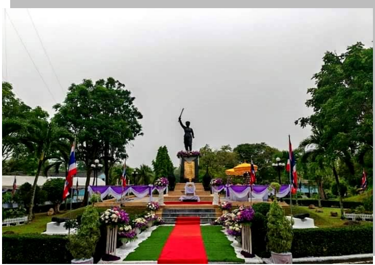
พิธีบวงสรวงศาลพระภูมิ